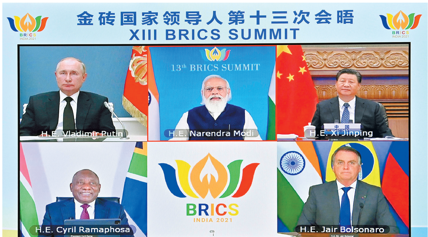
9月9日晚,金砖国家领导人第十三次会晤以视频方式举行。国家主席习近平在北京出席会晤并发表重要讲话。