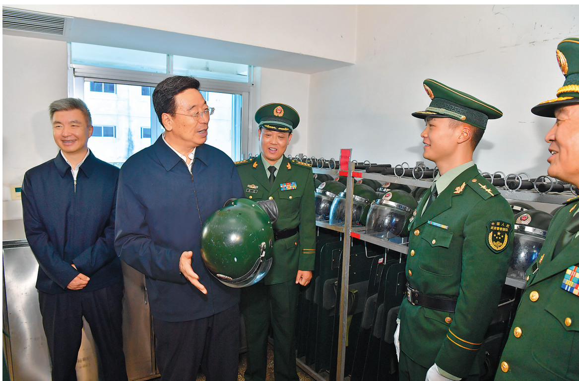
八一建军节前夕,自治区领导在拉萨亲切看望慰问驻藏人民解放军、武警部队官兵,与大家共庆建军佳节、共话鱼水深情。这是吴英杰询问武警官兵的装备和训练、生活等情况。

吴英杰指出,近年来,广大驻藏人民解放军、武警部队官兵坚决贯彻习近平强军思想,牢记使命、围绕中