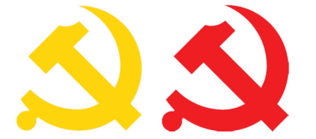
党徽图案标准颜色度值：黄色 R=253 G=207 B=48 红色 R=237 G=44 B=37