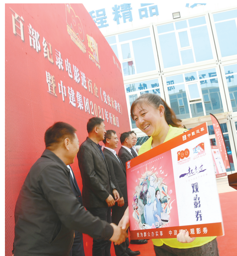
4月26日，中央新影集团、中建集团、中国企业文化促进会联合主办的百部纪录电影进百企《党史大讲堂》在中建三局北京公司承建的项目工地启动。中央新影集团将精选百部纪录电影，走进100家企业，让广大职工群众通过历史影像学习党史。