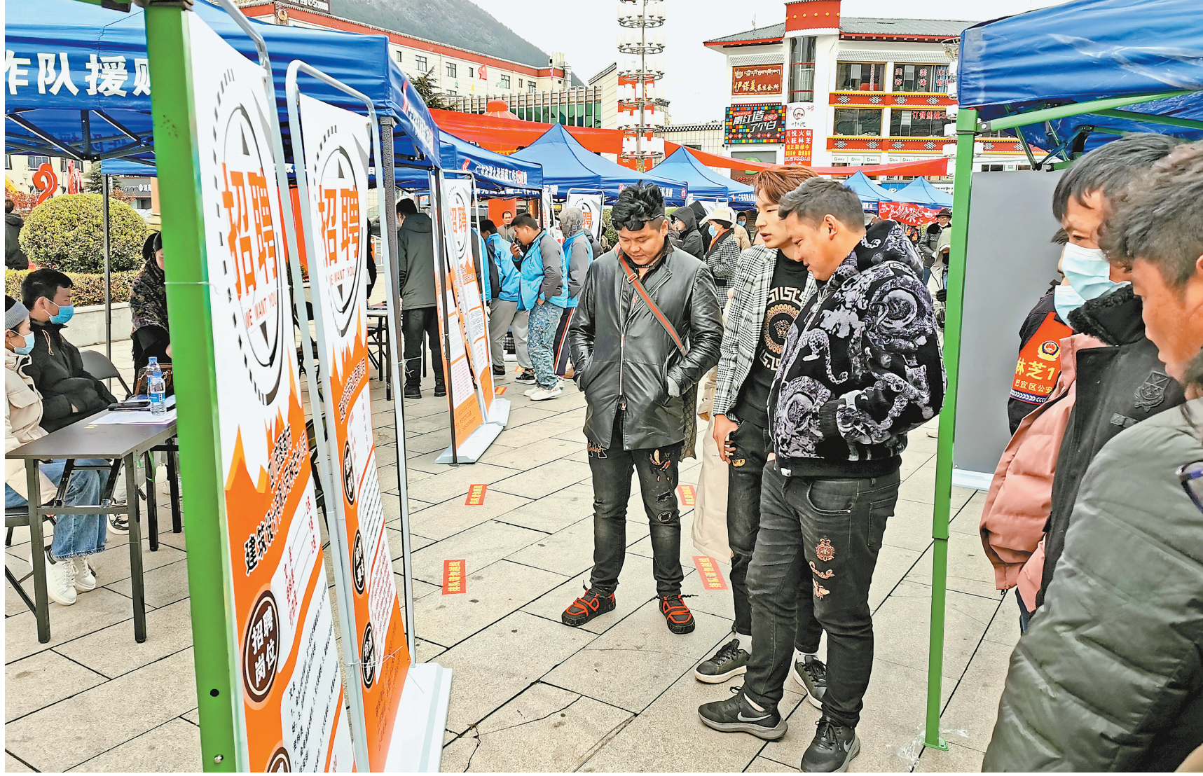
图为求职者在巴宜区组织的专场招聘会现场了解情况。