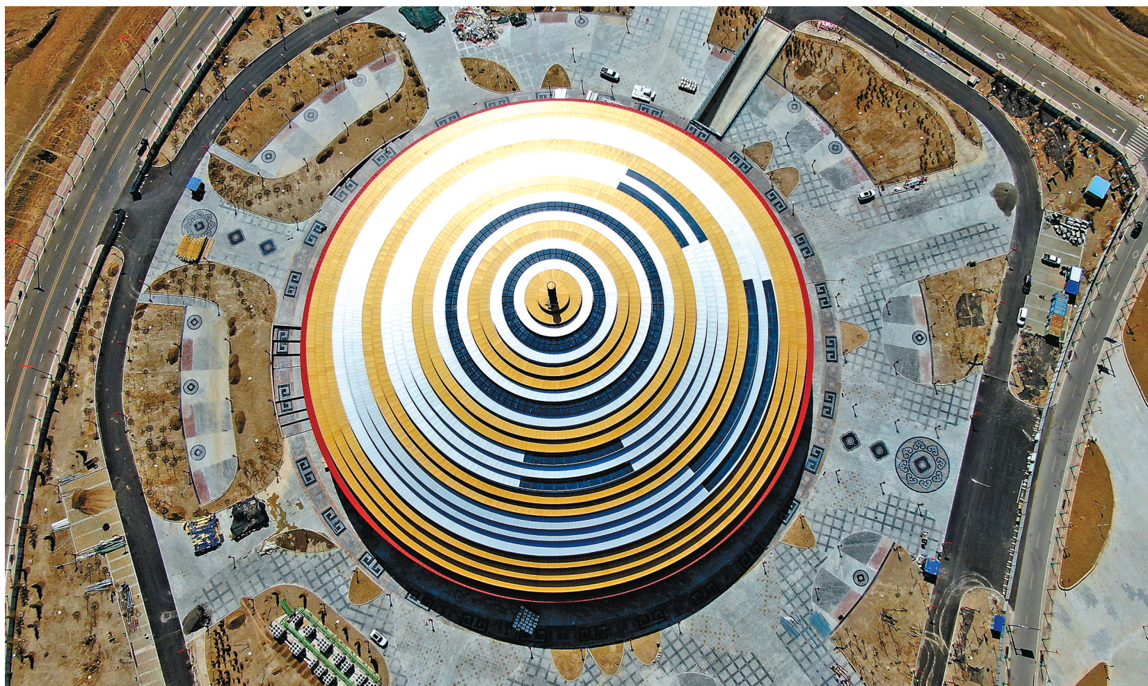
珠峰文化旅游创意园位于日喀则市城区西侧,规划范围面积9975亩,于2017年4月2日奠基并开工建设,2018年7月获批西藏自治区级文化产业示范园区。今年3月15日,园区正式复工,目前,作为珠峰文化旅游创意园标志性工程的日喀则博物馆项目已完成主体建设,预计今年六月开园。