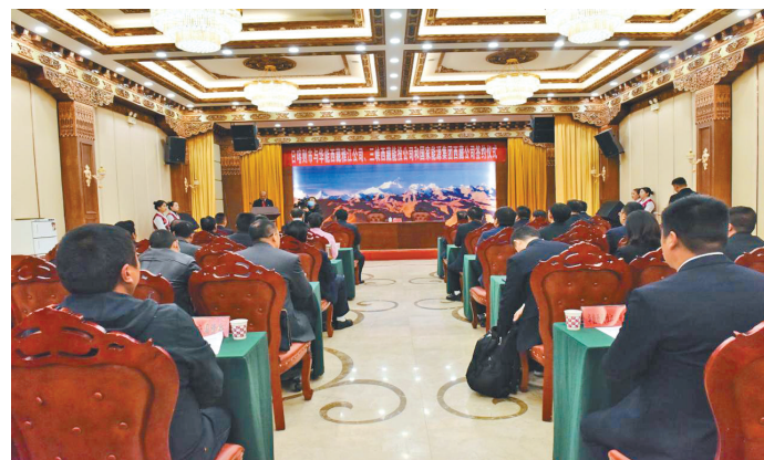
图为签约仪式现场。