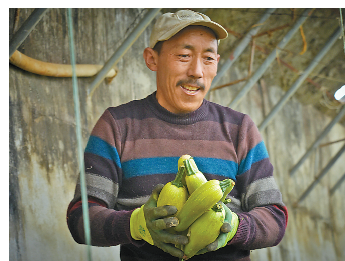
曲水县聂当乡德吉村村民在自家房屋附近建大棚种蔬菜，增加现金收入。

在脱贫致富的小康路上，与尼木县群众一起种出了雪域高原的“团结花”。他感恩地说：“这些真的非常感谢尼木县委、县政府、农业农村局、‘双创’办、拉萨净土等各级单位对我们的关注，对销量的帮助，现在才有这么多群众可以就近就业。新的一年，我们将会重点种植市场需求量大的菌，再拓宽销售渠道，让乡亲们手上的分红再多一些。”