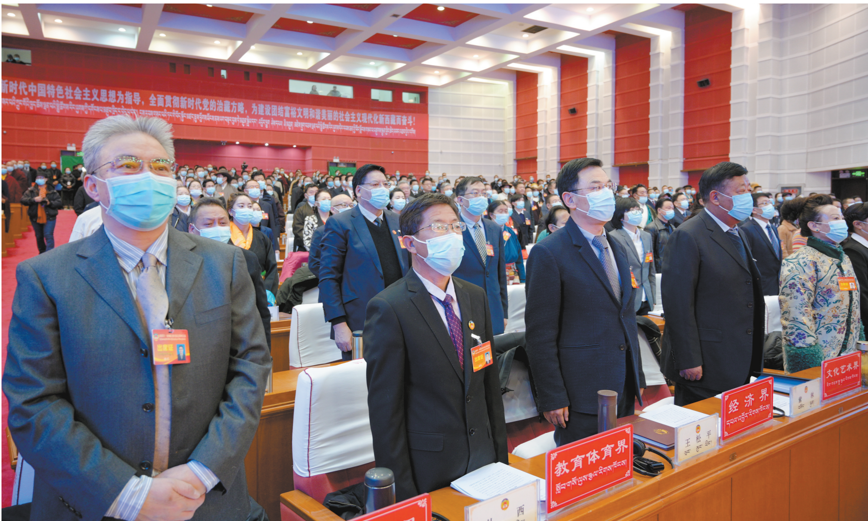
图为1月19日上午,自治区政协十一届四次会议开幕现场。