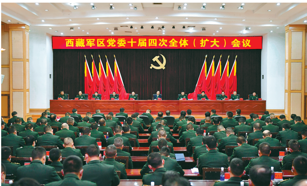
近日,西藏军区党委召开十届四次全体(扩大)会议。自治区党委书记、西藏军区党委第一书记吴英杰出席会议并讲话。这是大会现场。

本报拉萨1月12日讯(蒋翠莲 晏良)近日,西藏军区党委召开十届四次全体(扩大)会议。自治区党委书记、西藏军区党委第一书记吴英杰出席会议并讲话。他强调,要不忘初心、牢记使命,不断推进军区部队建设朝着新时代的强军目标坚实迈进,以维护祖国统一和领土完整、共同谱写新时代雪域高原长治久安和高质量发展新篇章的优异成绩,回报习近平总书记和党中央的关心厚爱,向中国共产党成立100周年、西藏和平解放70周年献礼。