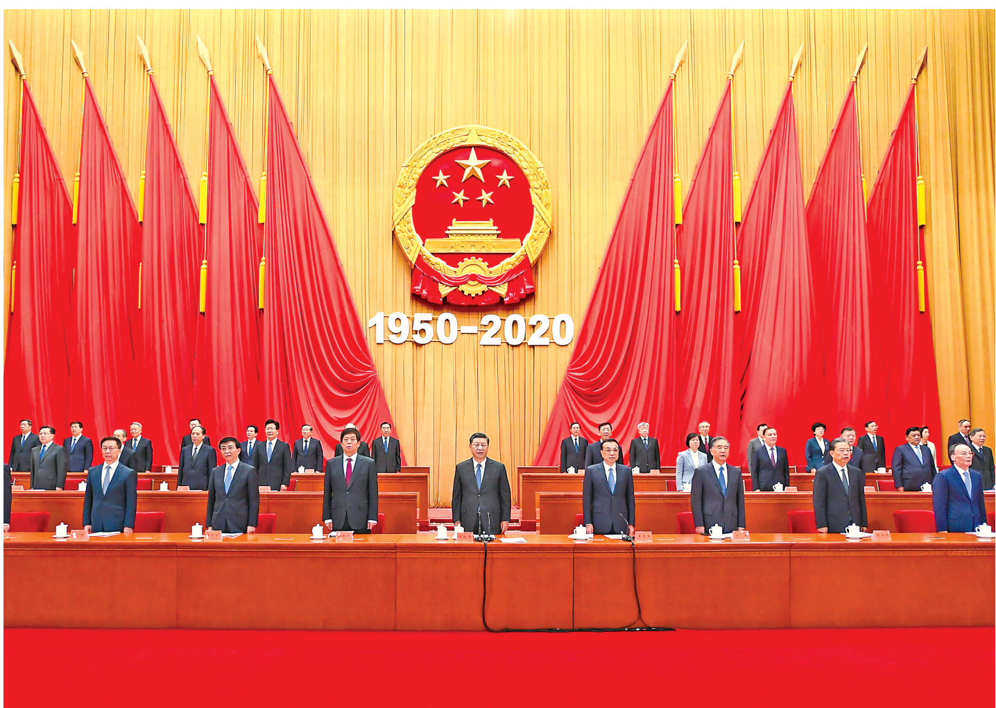
10月23日,纪念中国人民志愿军抗美援朝出国作战70周年大会在北京人民大会堂隆重举行。中共中央总书记、国家主席、中央军委主席习近平在大会上发表重要讲话。