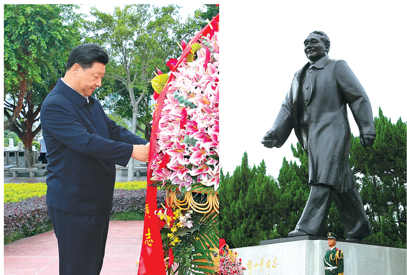
10月14日，深圳经济特区建立40周年庆祝大会在广东省深圳市隆重举行。中共中央总书记、国家主席、中央军委主席习近平在会上发表重要讲话。这是当天下午，习近平来到莲花山公园，向邓小平同志铜像敬献花篮。