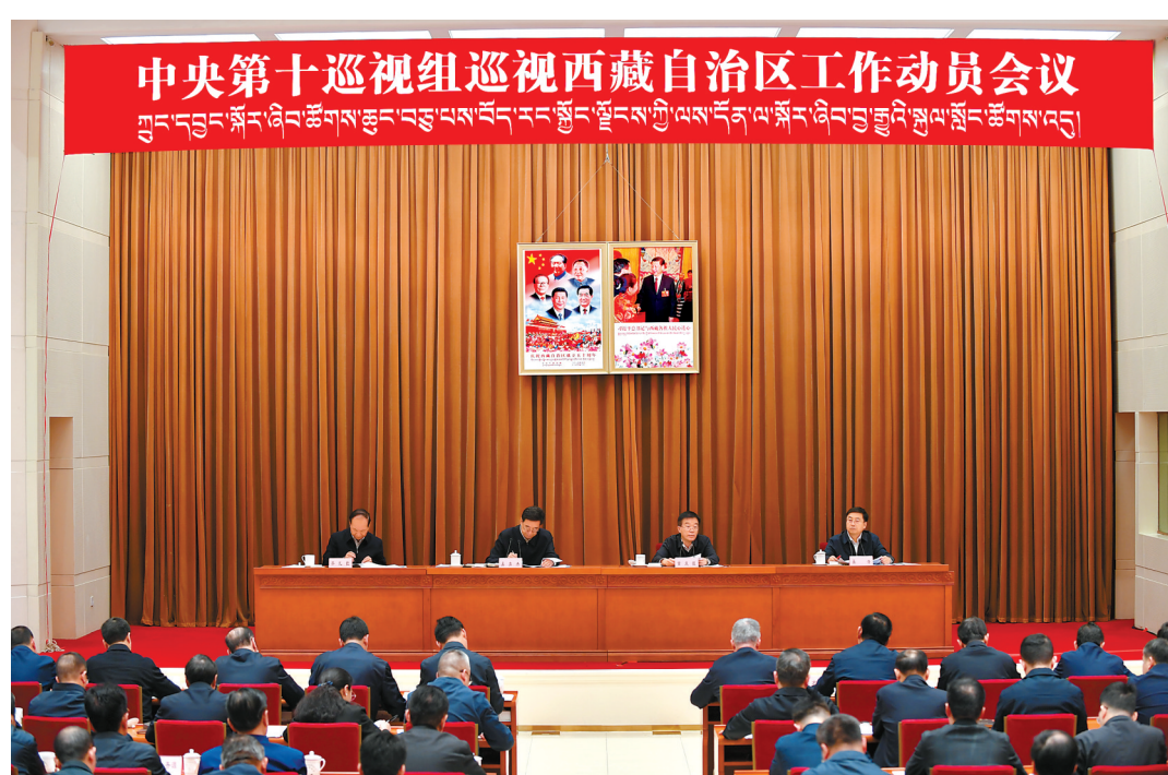
近日，中央第十巡视组巡视西藏自治区工作动员会召开。这是会议现场。

苗庆旺强调，今年是全面建成小康社会和“十三五”规划收官之年，也是脱贫攻坚决战决胜之年，对省市区和新疆生产建设兵团开展巡视，充分体现了以习近平同志为核心的党中央对各地工作的高度重视，是促进履行职能责任、督促做到“两个维护”，推动全面深化改革、促进国家治理体系和治理能力现代化建设，把“严”的主基调坚持下去、推进全面从严治党向纵深发展，践行以人民为中心的发展思想、密切党同人民群众血肉联系的重要举措。西藏自治区党委要提高政治站位，从“两个大