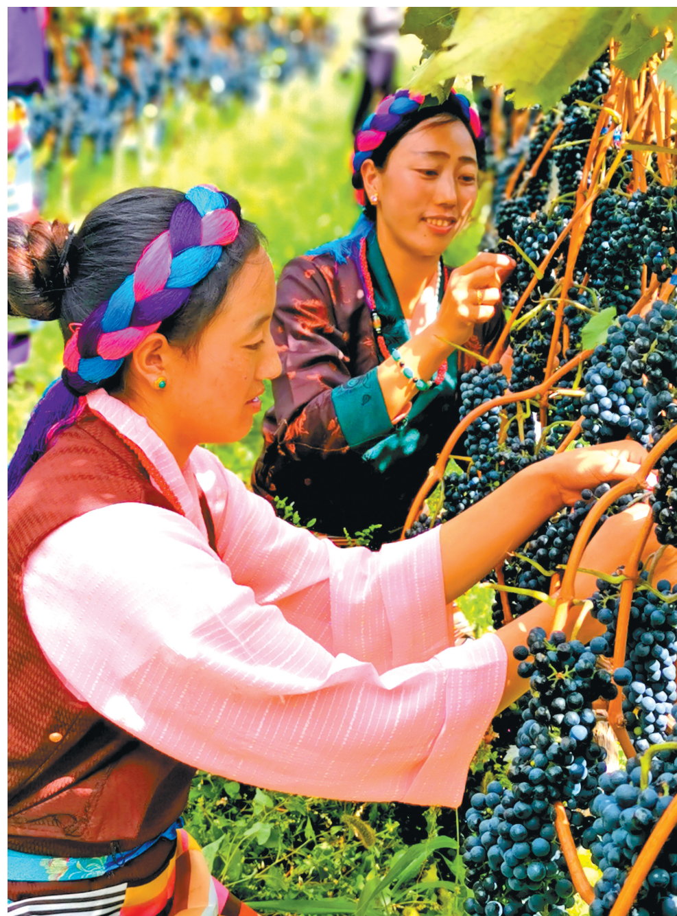
▲葡萄酿出美好新生活。

2020年是昌都解放70周年,是全面建成小康社会、“十三五”规划的收官之年,是第一个百年奋斗目标的实现之年。昌都市将继续高举中国特色社会主义伟大旗帜,坚持以习近平新时代中国特色社会主义思想为指导,全面贯彻新时代党的治藏方略和中央第七次西藏工作座谈会精神,不忘初心、牢记使命,改革创新、艰苦奋斗,想群众之所想、急群众之所急、解群众之所困,让改革发展成果更多更好地惠及昌都人民,奋力谱写好新形势下中华民族伟大复兴中国梦的昌都新篇。