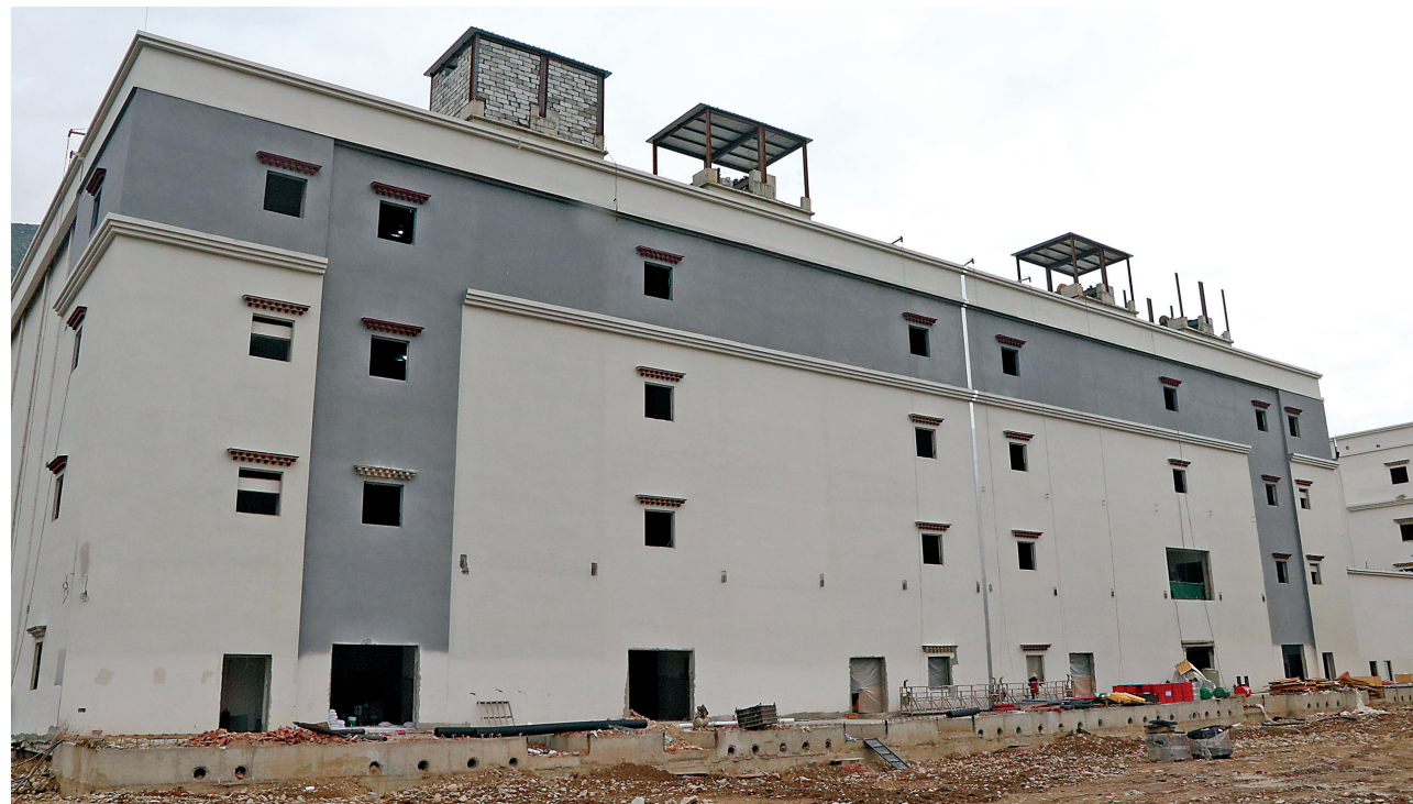
图为建设中的冷库外观。