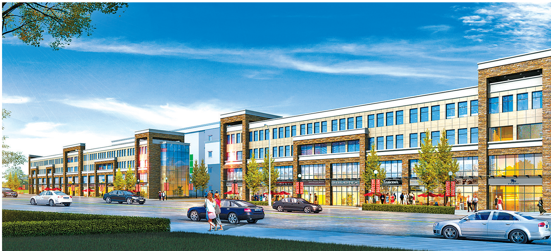
图为高原食品冷链中心项目新增建设沿街(效果图)。

民以食为天，食品和市民生活密切相关，因此食品安全相当重要。食品从田间地头到百姓餐桌，从原料获取直至到达最终消费者，以冷冻冷藏技术为基础的冷链物流在食品物流中扮演着重要的角色。