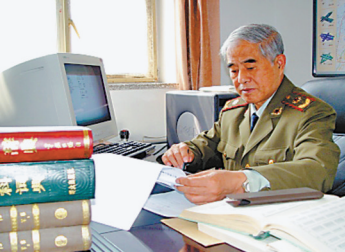
这是邱成龙像(资料照片)。

据新华社北京电(记者张汨汨李兵峰)邱成龙是火箭军研究院某所原研究员,1940年出生,1961年被保送到军校学习,1962年入党,2009年因病去世。他获得国家和军队科技进步奖17项,是我国战略导弹作战运用学科专业研究带头人、我军常规导弹作战运用专业研究奠基人、战略导弹部队作战运用研究领域领导人。他始终潜心导弹火力运用研究,先后上百次深入部队和工厂,了解部队需求及工业部门情况。他40余次到靶场和试验场,为导弹武器装备发展掌握一手资料及接受实战检验,多次参加全军、战略导弹部队组织的重大演习及战备任务,为指挥决策提供咨询和技术保障。