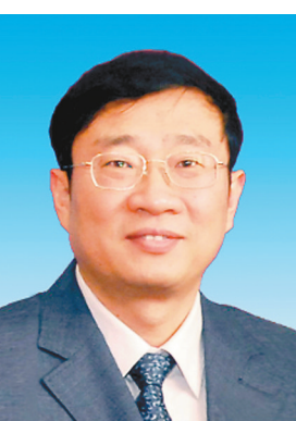
这是罗阳像(资料照片)。

据新华社沈阳电(记者李铮张逸飞)2013年以来,每到清明时节中航工业沈飞公司的员工们都会自发来到前董事长、总经理罗阳的塑像前悼念。他的另一个身份是我国歼-15舰载机研制现场总指挥。 站在塑像前,那位总是笑容谦逊,一身蓝色工作服永远整洁利落,浅色眼镜后目光柔和坚定的总指挥好像未曾走远,好像搭载着他亲手打造的歼-15战斗机的母舰——辽宁舰鸣笛为他送行就在昨天…… 2012年11月25日上午,大连港码头锣鼓齐鸣,彩旗招展。胜利完成中国首次航母舰载机着舰任务的“辽宁号”缓缓驶入港口。沈阳黎明航空发动机(集团)有限公司董事长孟军在辽宁舰上向码头望去,激动地说:“老罗快看过来,沈飞的弟兄们在向你招手呢!”罗阳倚靠在床边,手捂着胸口,轻声说道:“算了,我有点不舒服。” 孟军看他脸色不太好,赶紧询问:“要不要先找医生看一下?”罗阳摇摇头说:“没事,下船再说吧。”9时4分,罗阳慢慢走下“辽宁舰”。罗阳坚持最后一排等候的人挨个握了手。所有人都没想到,这是他们和罗阳的最后一次握手。 一个多小时后,载着罗阳的车辆疾驰向大连连日医院。在离急诊部不到100米的地方,罗阳的心脏停止了跳动。 “罗阳,你太累了。”妻子王希利一声悲啼,