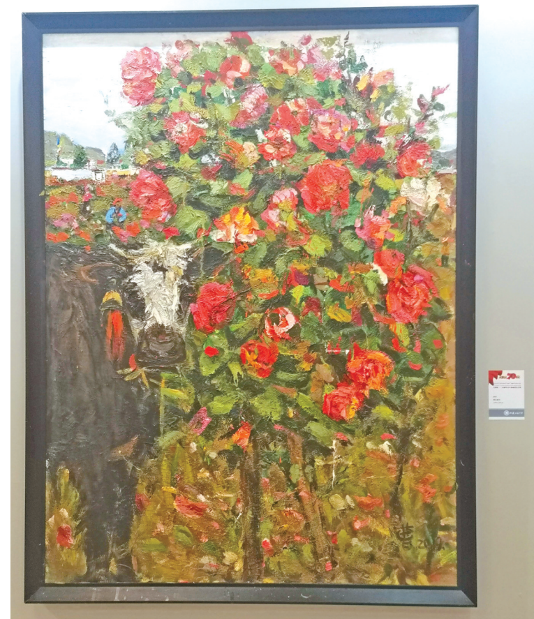
曹梦的布面油画《艳阳》。