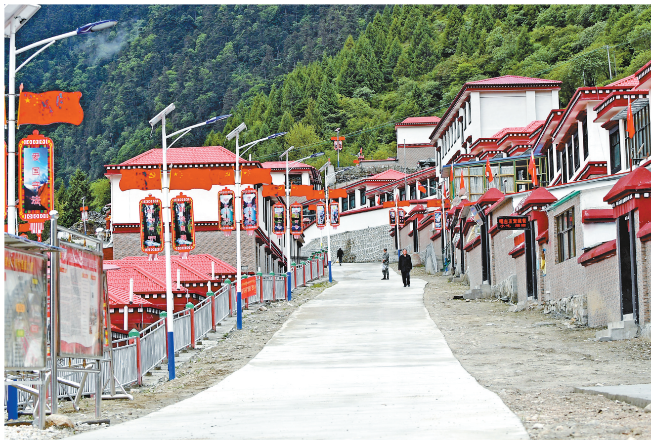
已建成投用的洛扎县拉郎村村道。