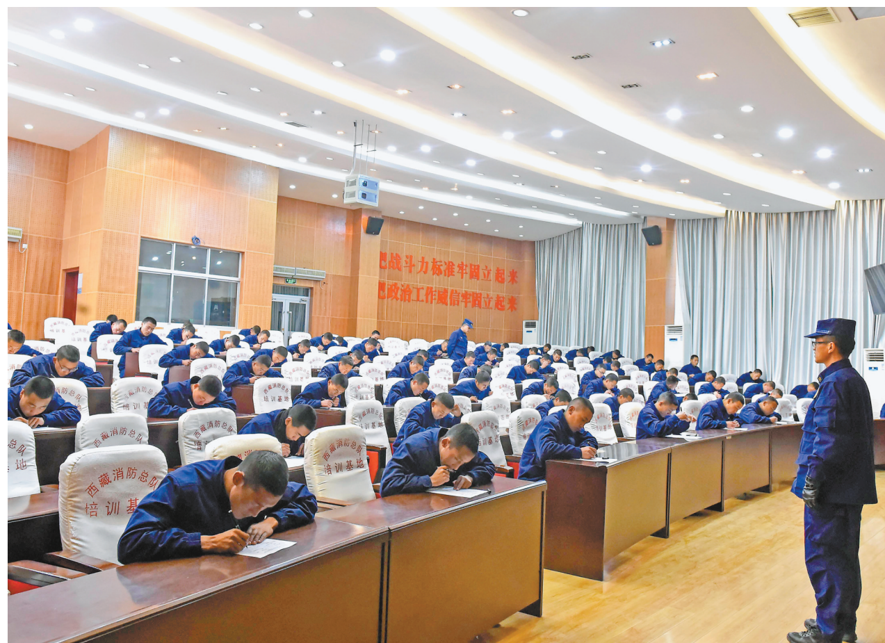
▲基础理论考核。 ▼单杠考核。