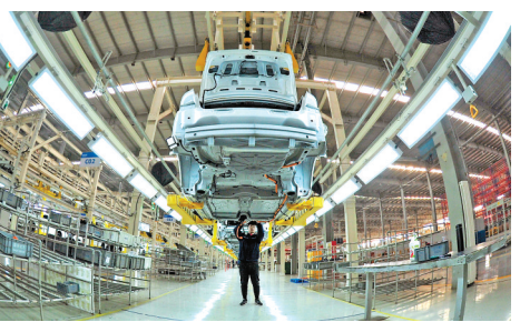
12月21日,工人在北汽新能源黄骅分公司总装车间内工作。

近年来,河北省黄骅市抢抓京津冀协同发展机遇,以北汽新能源黄骅分公司为龙头带动,引进一大批汽车产业项目。目前,黄骅市形成了集研发设计、模具制造、整车生产、专用车改装、零部件制造、回收再利用的完整产业链,汽车产业年产值50多亿元,汽车产业已成为当地经济发展的新动能。