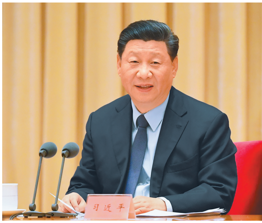
12月10日至12日,中央经济工作会议在北京举行。中共中央总书记、国家主席、中央军委主席习近平发表重要讲话。