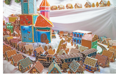
这是12月10日在波兰格利维采拍摄的由姜饼做成的铁路模型。