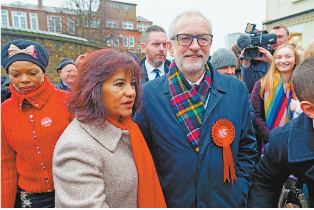
英国议会下院选举投票于当地时间12日7时开始。此次选举被称为“决定命运”的一次选举。图为12月12日,在英国伦敦,英国工党领袖科尔宾(前左三)与妻子在一处投票站投票后离开。

松,近半年来不少商人和私营企业重新回到委内瑞拉经营,他们还不断投资购买商铺和土地。同时,由于政府对商品价格的干预大大减少,物资匮乏的现象得到缓解。