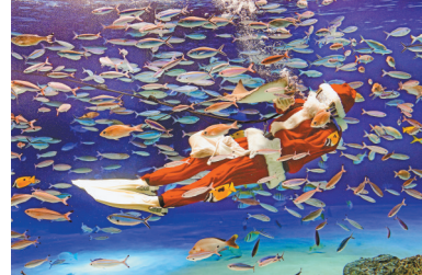
12月10日,在日本东京阳光水族馆,一名装扮成圣诞老人的潜水员与鱼共舞。