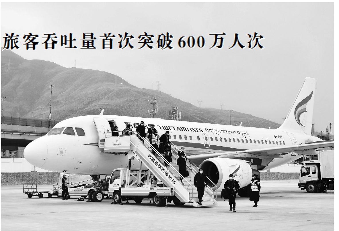
图为西藏航空航班安全抵达民航西藏区局停机位。

“真情服务”是民航三条底线之一,是践行“人民航空为人民”的根本体现。2021年,拉萨贡嘎机场T3航站楼正式投用,“四型机场”水平进一步提高,服务人民群众出行的能力大大提升。自党史学习教育开展以来,民航西藏区局