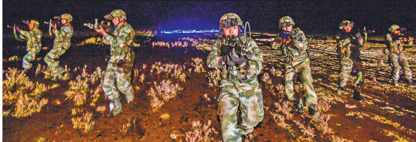
图为演练中侦察分队向目标点摸索前进。